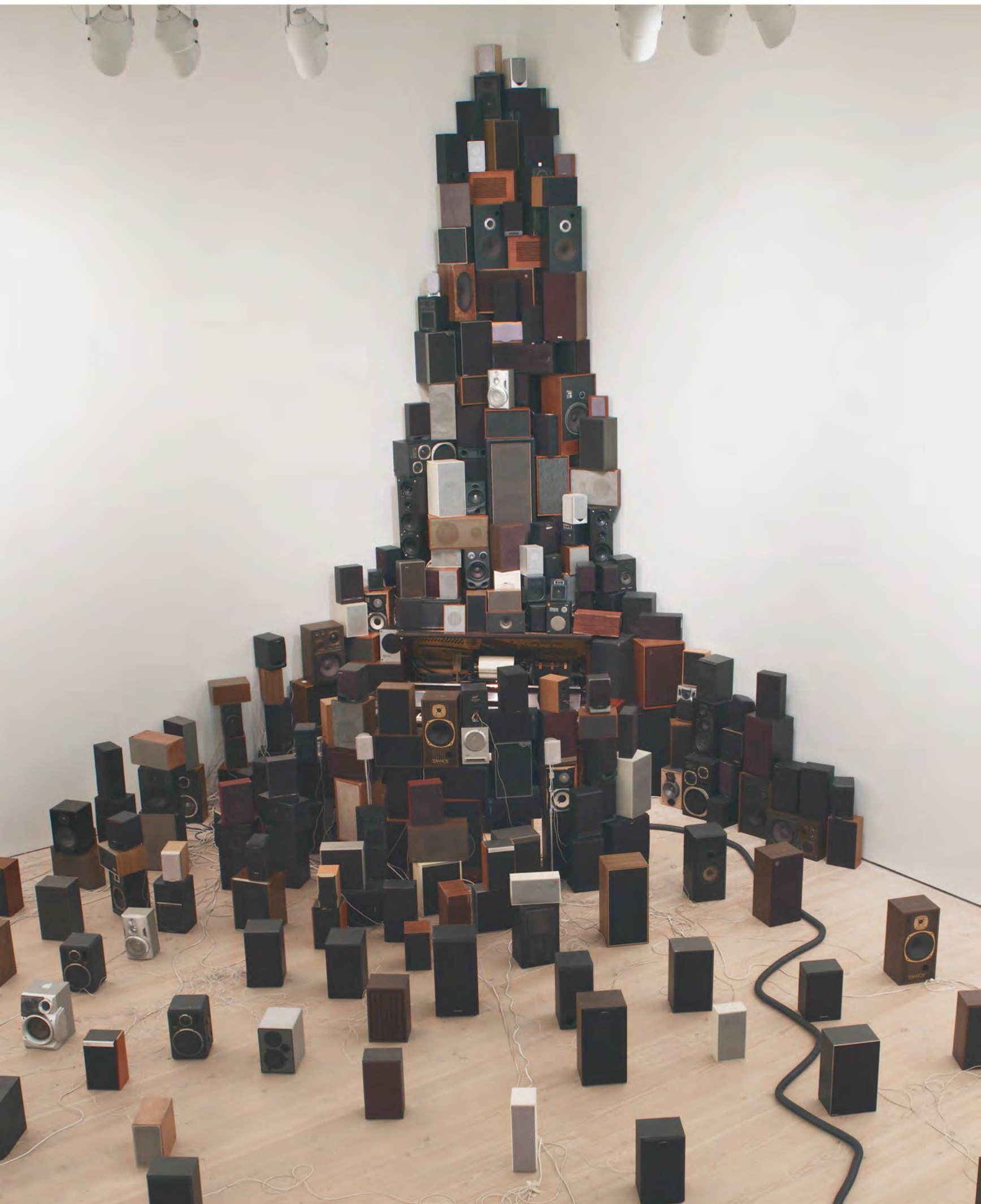
John Wynne, 'Installation for 300 speakers, Pianola and vacuum cleaner', 2010